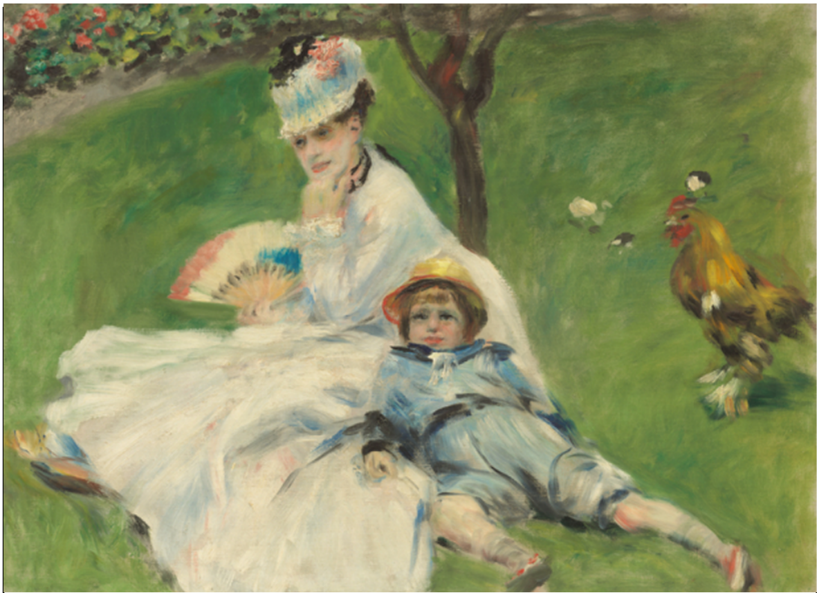
Mme Monet et son fils, peints par Pierre-Auguste Renoir

A droite, un coq regarde les deux personnages. Nous sommes dans un jardin dont la pelouse est bien tondue.